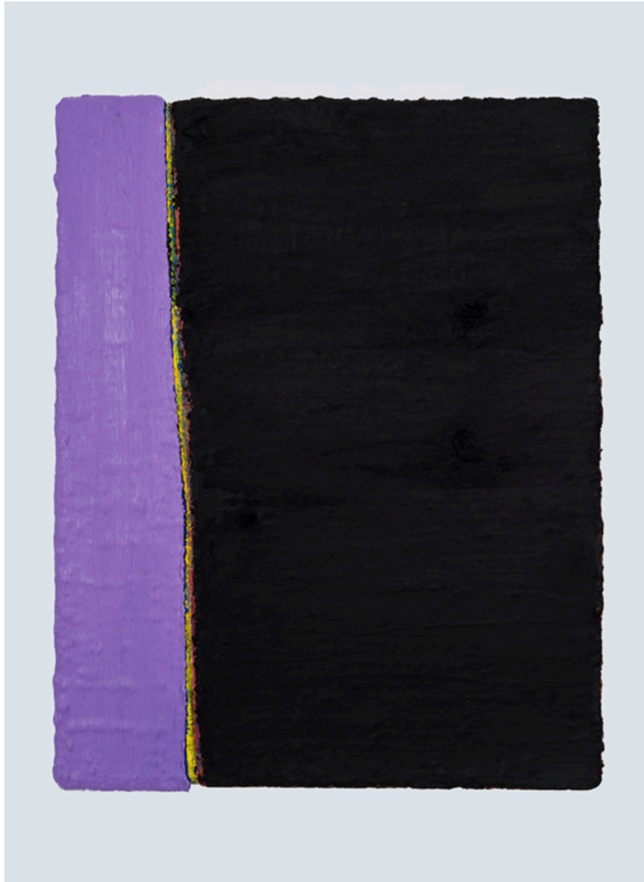
PAUL BUREAU | NEW CUT (R) | OIL ON CANVAS | 71 X 50 INCHES | 2008

2401 BANK STREET OTTAWA CANADA K1V 8R9 T.613.746.0690 1.800.388.3298 F.613.746.4996 PATRICKMIKHAILGALLERY.COM